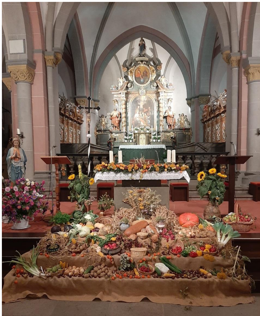
Erntedankaltar in St. Peter und Paul Obermarsberg